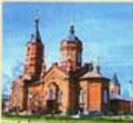
Курганская и Белозерская епархия