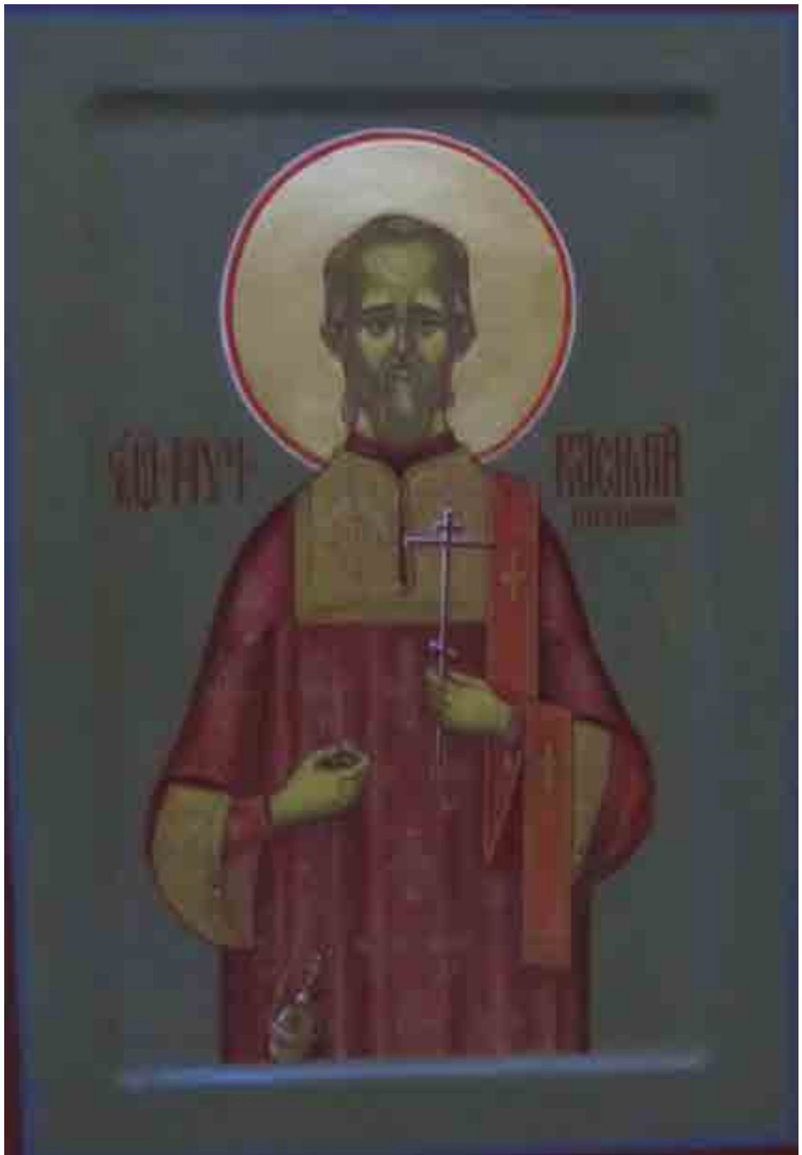
Икона сщмч. диакона Николаевской Далматовской церкви Василия Ситникова, написанная иконописцем О. А. Серебrenниковым для Далматовского монастыря в 2017 г.